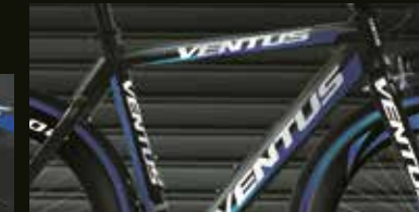
Decoración de bicicletas de carretera con adhesivos