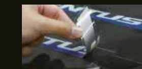
Producción de tiradas cortas de etiquetas y pegatinas

La reconocida tecnología de impresión y corte integrados de Roland ofrece la potencia y versatilidad que exige su negocio. Imprime y corta automáticamente el contorno de imágenes en cualquier forma, dentro de un flujo de trabajo fluido. Con el XR-640, puede crear una gran variedad de aplicaciones personalizadas de forma rápida, sencilla y rentable, incluyendo expositores para puntos de venta, señalización para el suelo, pegatinas, adhesivos para vehículos y transferencias térmicas para ropa.