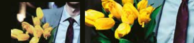
Impreso con un modelo convencional / Impreso con el SOLJET PRO4 XR-640

La tecnología de impresión de Roland consigue unos colores impresionantes e intensos, maximizando así el rendimiento de los nuevos cabezales de impresión dobles y de la tinta ECO-SOL MAX